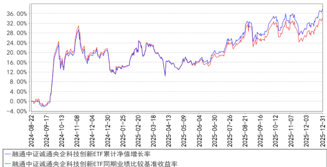
融通中证诚通央企科技创新ETF累计净值增长率与同期业绩比较基准收益率的历史走势对比图

注：本基金的建仓期为自合同生效日起6个月，至建仓期结束，各项资产配置比例符合合同约定。