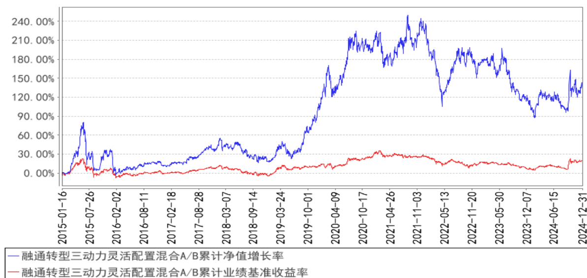
融通转型三动力灵活配置混合A/B累计净值增长率与同期业绩比较基准收益率的历史走势对比图