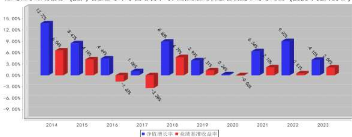
融通四季添利债券 (LOF) A基金每年净值增长率与同期业绩比较基准收益率的对比图 (2023年12月31日)